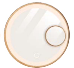
☞ Naturel ☞