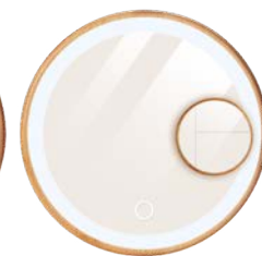
☞ Froid ☞