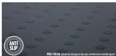
PDS-110 AS, détail du design et de son revêtement antidérapant