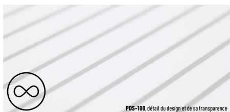
PDS-100, détail du design et de sa transparence