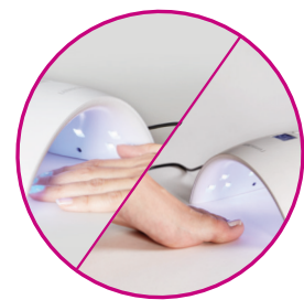
Mains & Pieds