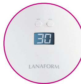
Timer LED : 30" Timer UV : 60" - 90"