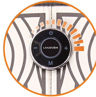
15 intensités & 2 modes de 25'