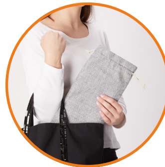
Tapis ultrafin, pliable & housse de transport