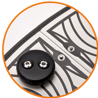
Batterie rechargeable via USB