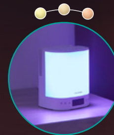
☀ NATUURLIJKE SFEERLAMPEN